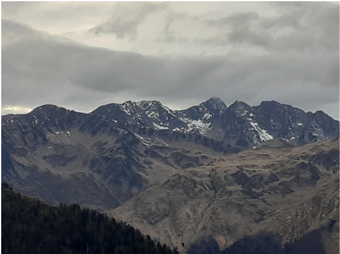
Vista desde la Vall d'Aran