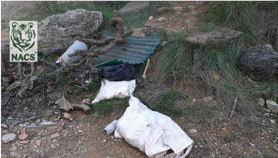
Vertidos de obra depositados en un bosque en Corbera de Llobregat.