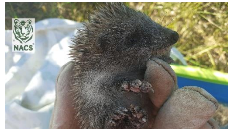
Ejemplar de cría de erizo recogido

▶ El 12 de junio fuimos llamados por un vecino que se había encontrado unas crías de erizo europeo cerca de su casa en Cervelló. Tras verificar que no había ninguna madre cerca, se procedió a trasladar las crías al Centro de Recuperación de Fauna Salvaje de la Torreferrusa.